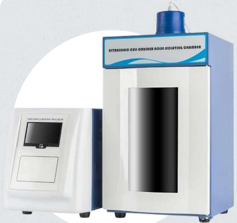
Sonicador de vástago – Biobase