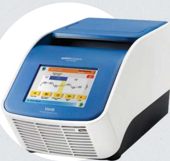
Termociclador PCR – Termociclador biometra t one, Applied Veriti