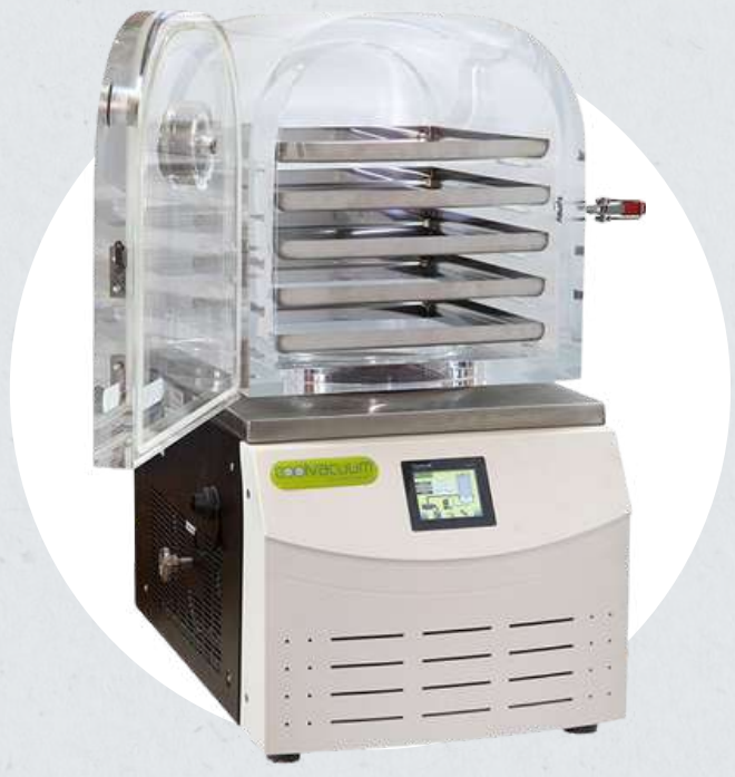
Liofilización de muestras – Coolvacuum technologies