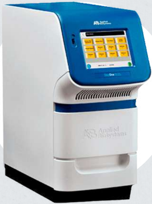
RT PCR – Applied Byosystems Step One Plus