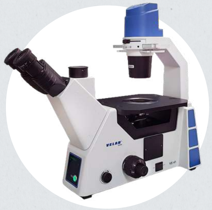
Microscopio invertido – Euromex