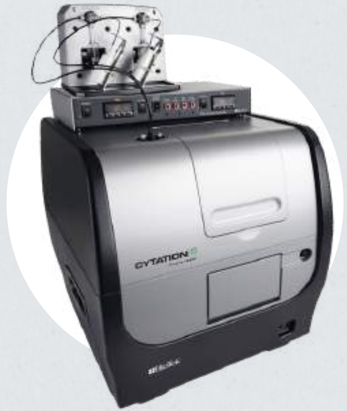
Lector de microplacas con microscopía de fluorescencia