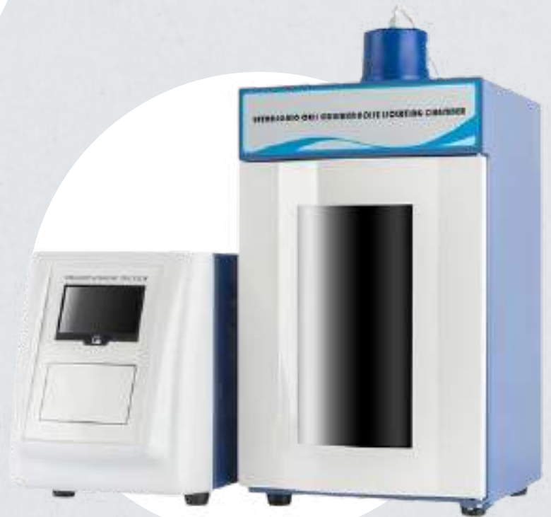
Sonicador de vástago