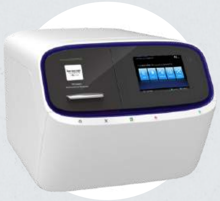
NGS lector de placas