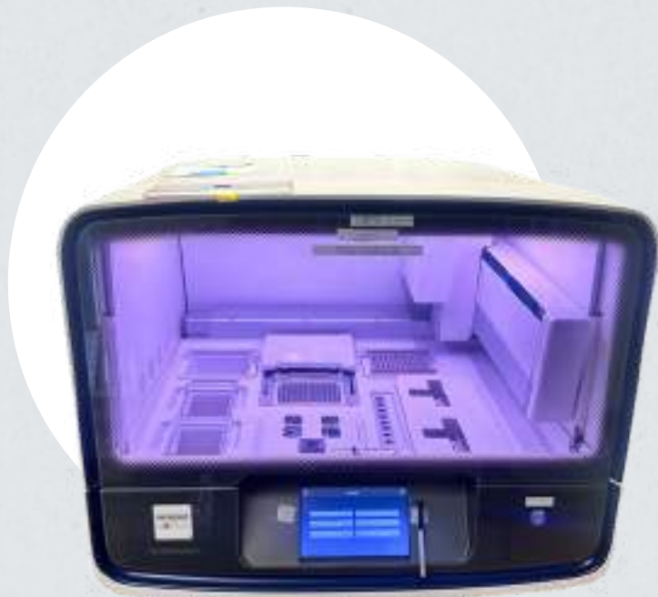
NGS cargador de placas