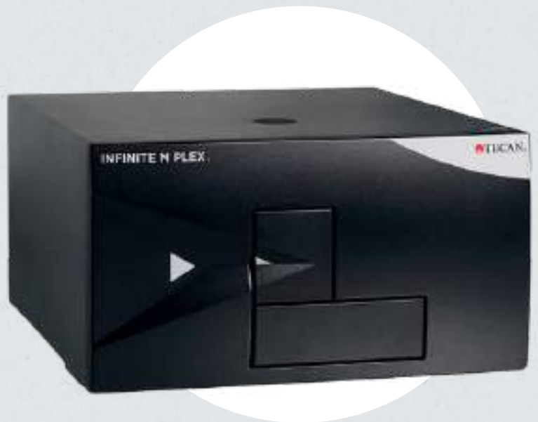
Lector de placas absorbencia y fluorescencia