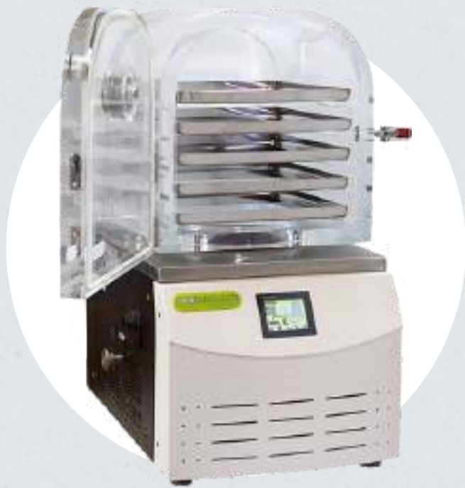
Liofilización de muestras