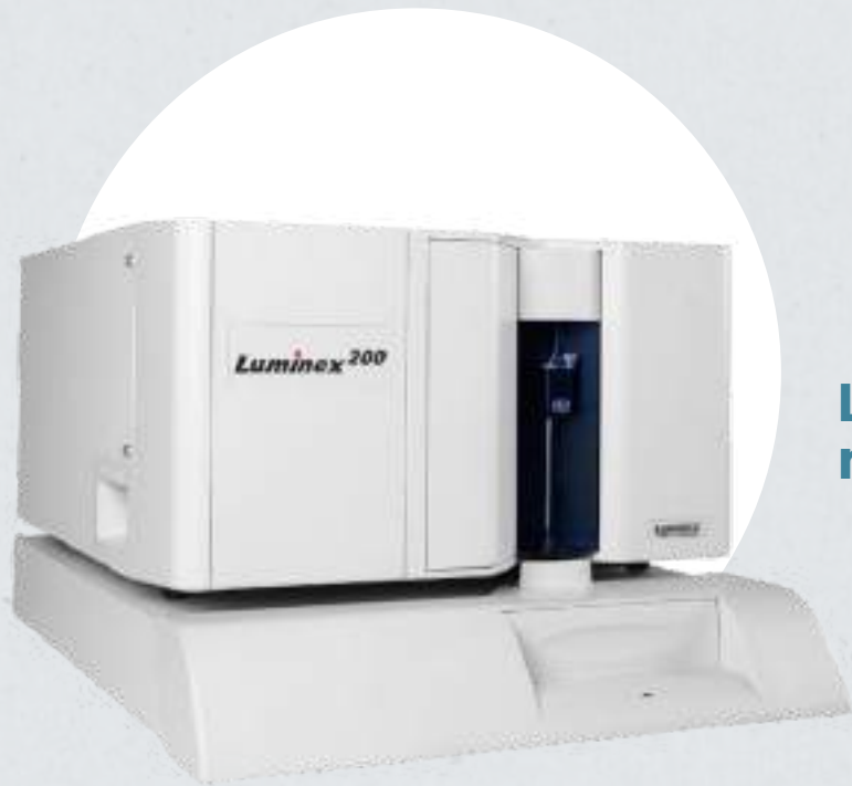
Lector ELISA multiplexado